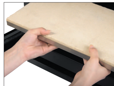
Défecteur inox doublé vermiculite amovible sans outil