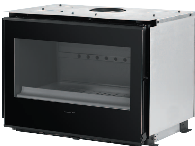
800 HORIZON FV