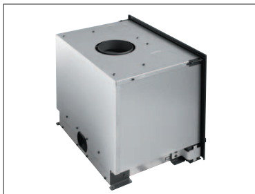
Carénage complet (monté de série)