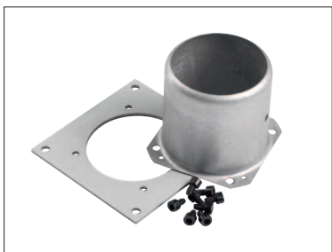
Buse de raccordement d'air Ø 75 mm