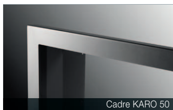
Cadre KARO 50