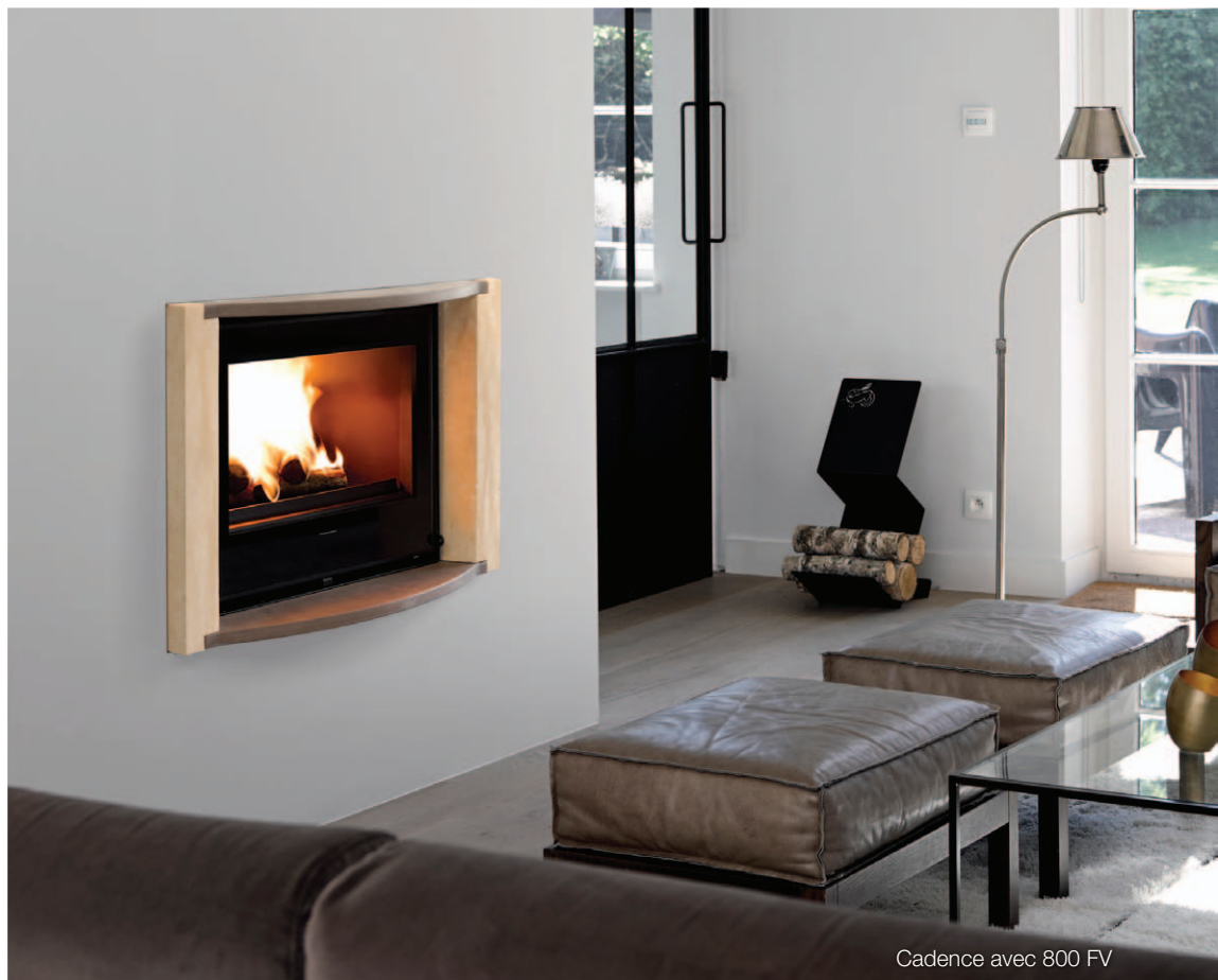
Cadence avec 800 FV