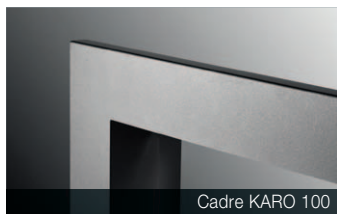
Cadre KARO 100