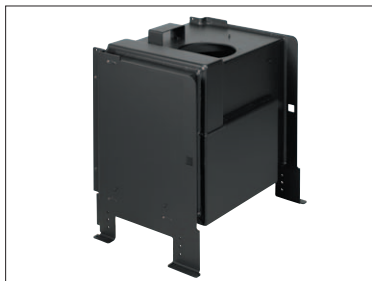
Corps de chauffe sans carénage - Corps de chauffe étanche et raccordable - Air primaire, secondaire et air de vitre canalisés - Double combustion sur l'arrière de l'appareil